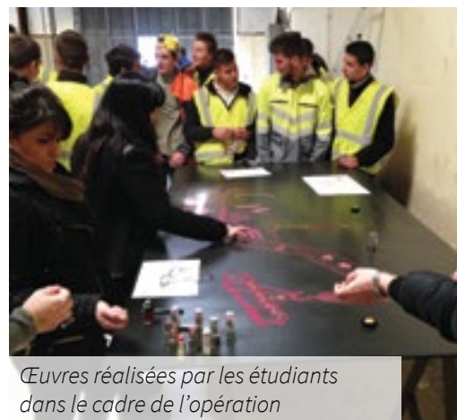
Œuvres réalisées par les étudiants dans le cadre de l'opération

Initiée par le préfet de Région et le Conseil Régional PACA, cette démarche vise à favoriser l'accès des femmes aux professions «réputées masculines». Elle est inscrite dans les orientations fixées par la convention interministérielle pour favoriser l'égalité entre les filles et les garçons dans le système éducatif. A l'occasion de cette manifestation, le CFA a présenté une exposition photo de travaux réalisés par les étudiants.