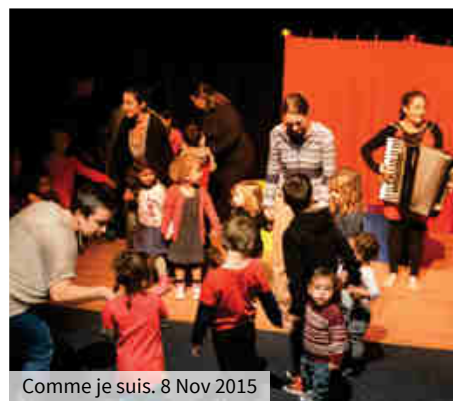
Comme je suis. 8 Nov 2015