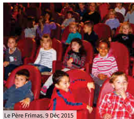
Le Père Frimas. 9 Déc 2015