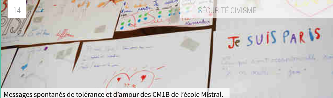
Messages spontanés de tolérance et d'amour des CM1B de l'école Mijstral.