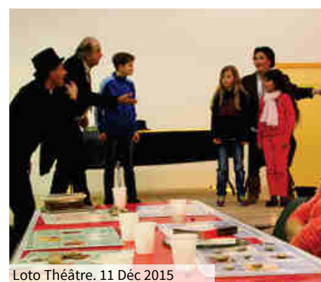
Loto Théâtre. 11 Déc 2015