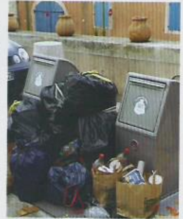
Place du Paty