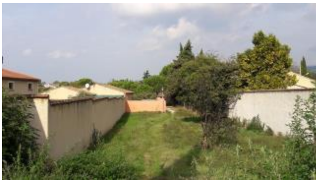
Passage vers le lotissement de la Mignonière . L'éclairage public est en place