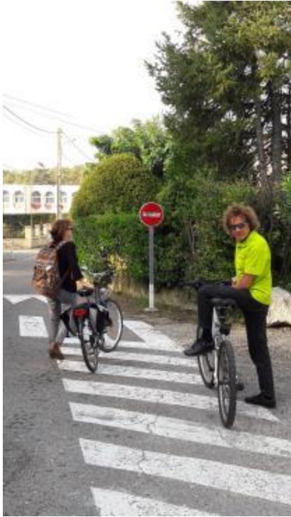
Sens unique rue Paul Cézanne. Il faut descendre de vélo pour faire les 50 mètres qui permettent de joindre l'école ou l'avenue d'Agliana