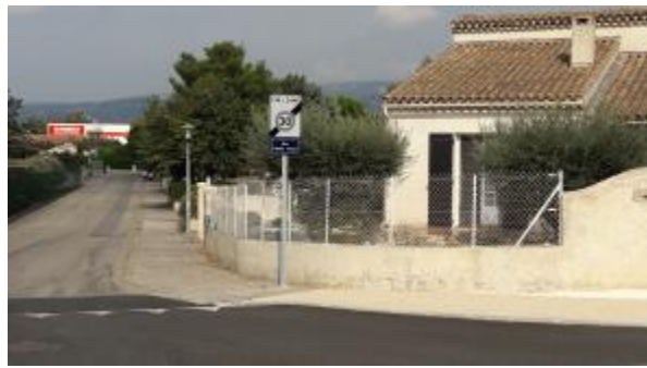
Sortie de Zone 30, on entre dans un lotissement : il n'y a plus de voie cyclable et on peut désormais rouler à 50 km/h !