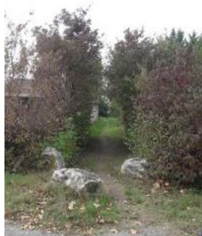
Passage vers le lotissement Clos Hubert