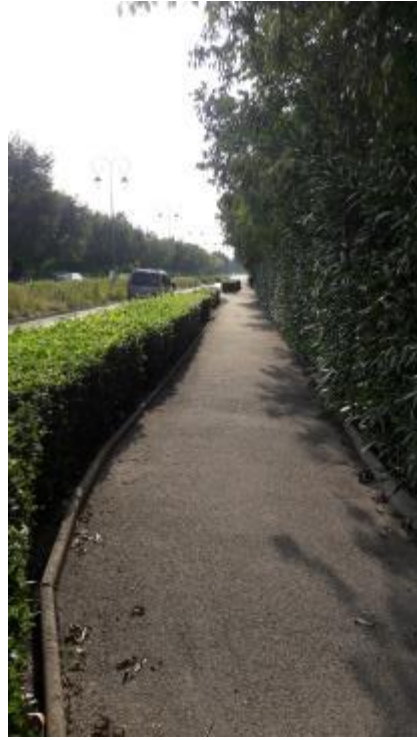
L'avenue Charles De Gaulle est adaptée aux piétons mais pas du tout aux vélos