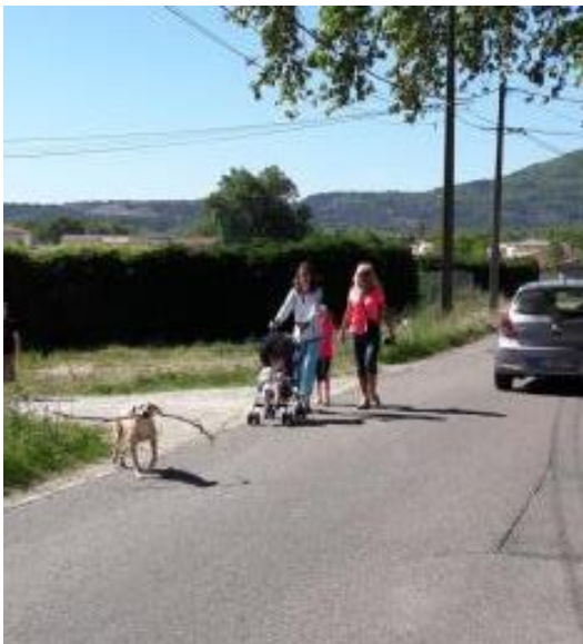
Cheminement piétons sur l'avenue Joliot-Curie....