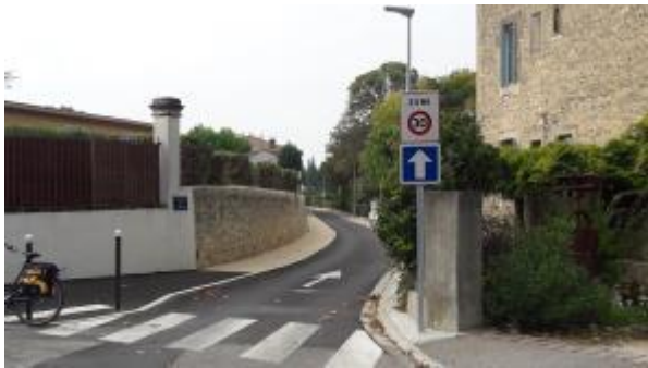
Entrée en Zone 30 : ce panneau signifie que la vitesse est limitée à 30 km/h et que des vélos peuvent venir en sens inverse !