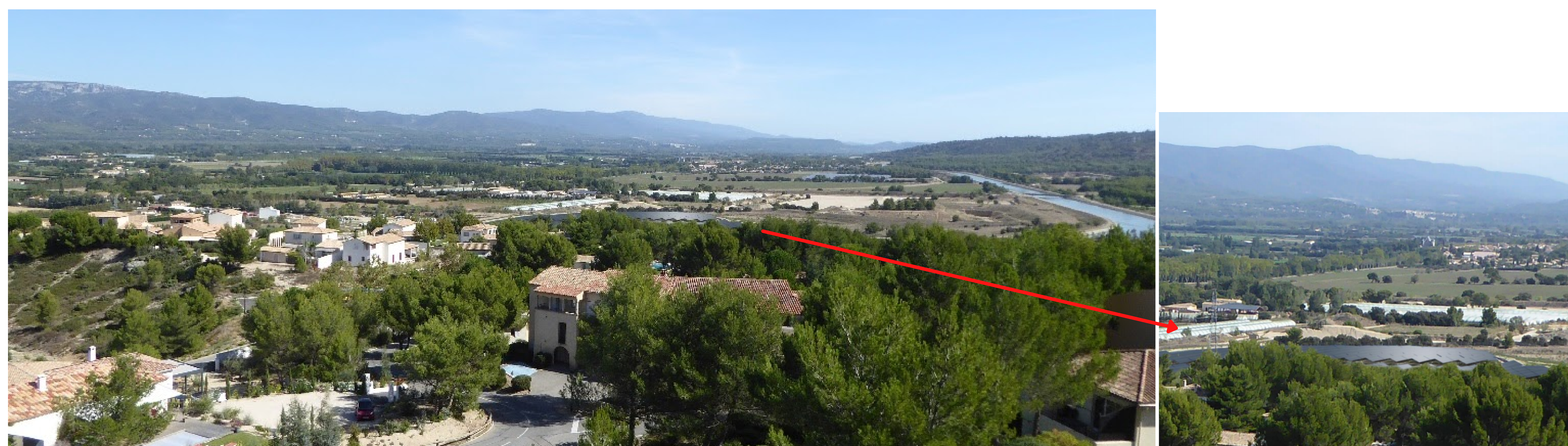
Depuis l'un des appartements en hauteur du Domaine de Pont-Royal