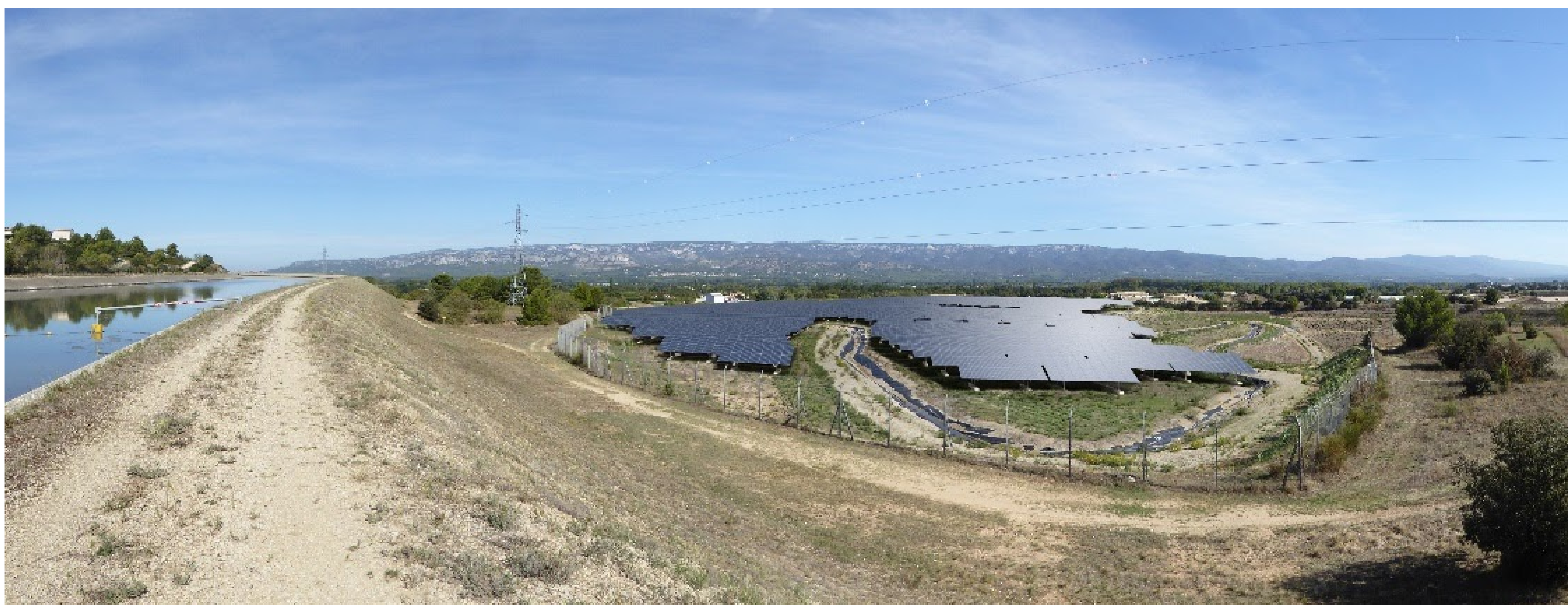
Depuis le haut du talus en bordure du canal EDF