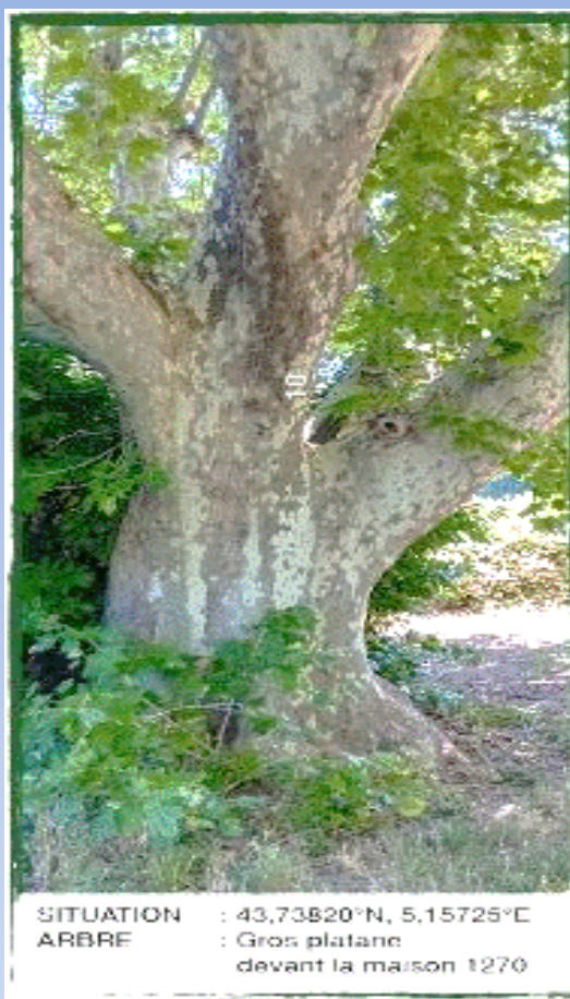
SITUATION : 43,73520° N, 5,15725° E ARBRE : Gros platane devant la maison 1270